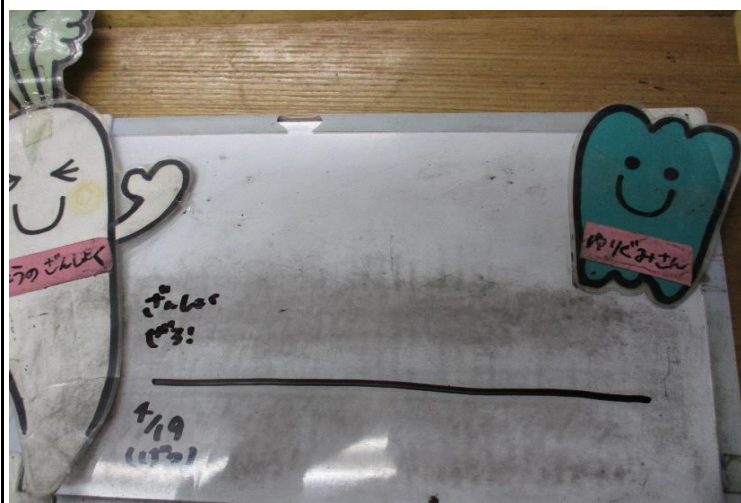
【離乳食】 豚肉の生姜焼き・干草和え・椎茸出汁のお吸い物